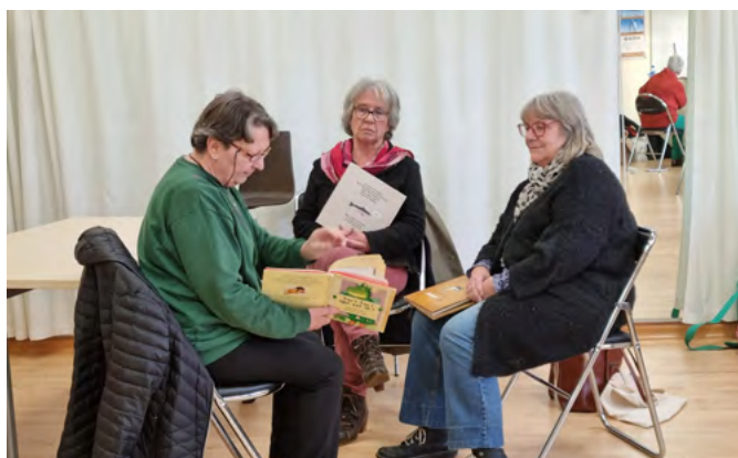
Formation des départements de Mayenne et Sarthe à Evron, décembre 2022

Dans le cadre de la remobilisation Lire et faire lire a accompagné vingt coordinations dans l'organisation de formations interdépartementales.