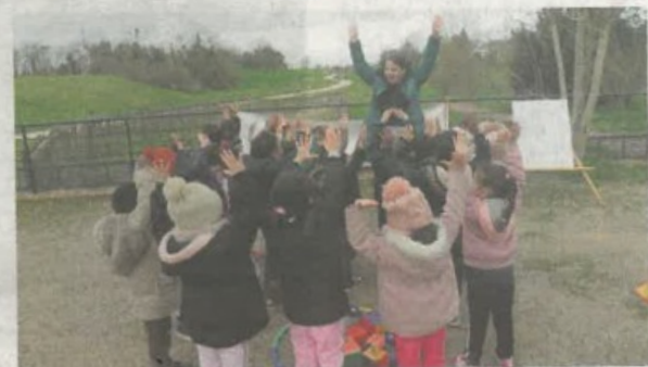
Un parcours ponctué d'ateliers sportifs.

Après une première rencontre « 1-2-3 Usep en maternelle » en septembre et octobre derniers, l'Usep 41 organise actuellement une deuxième édition avec pour thème la randonnée sportive et contée. Au programme, une boucle balisée d'environ 2 km accompagnée d'ateliers sportifs. Et une pause lecture animée par des bénévoles de la Ligue de l'enseignement « Lire et Faire Lire » Lundi matin, quatre-vingts élèves des écoles maternelles Jules-Ferry et Simone-de-Beau-